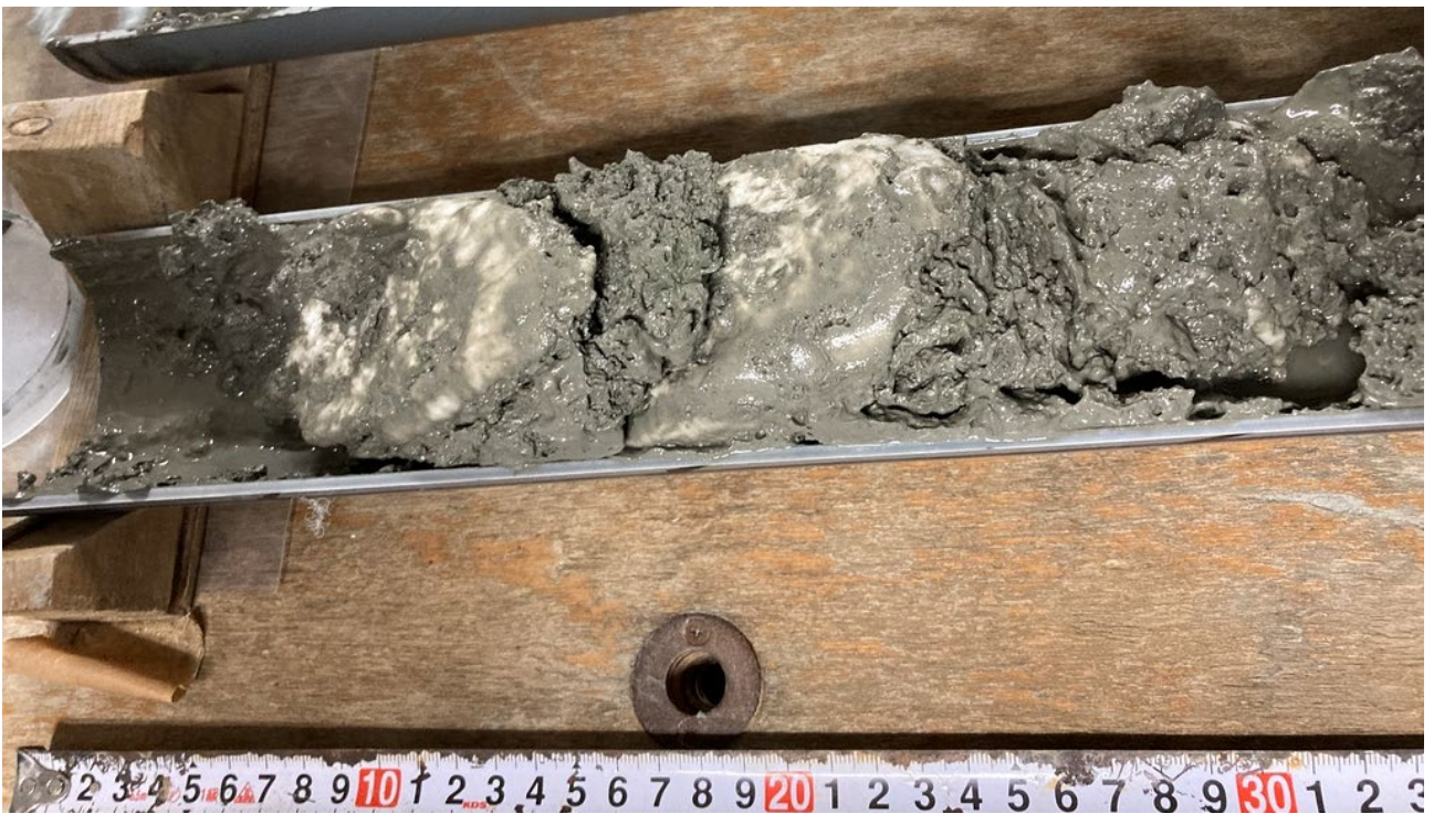
図3 採取されたメタンハイドレート（白い固体状の部分がメタンハイドレート）