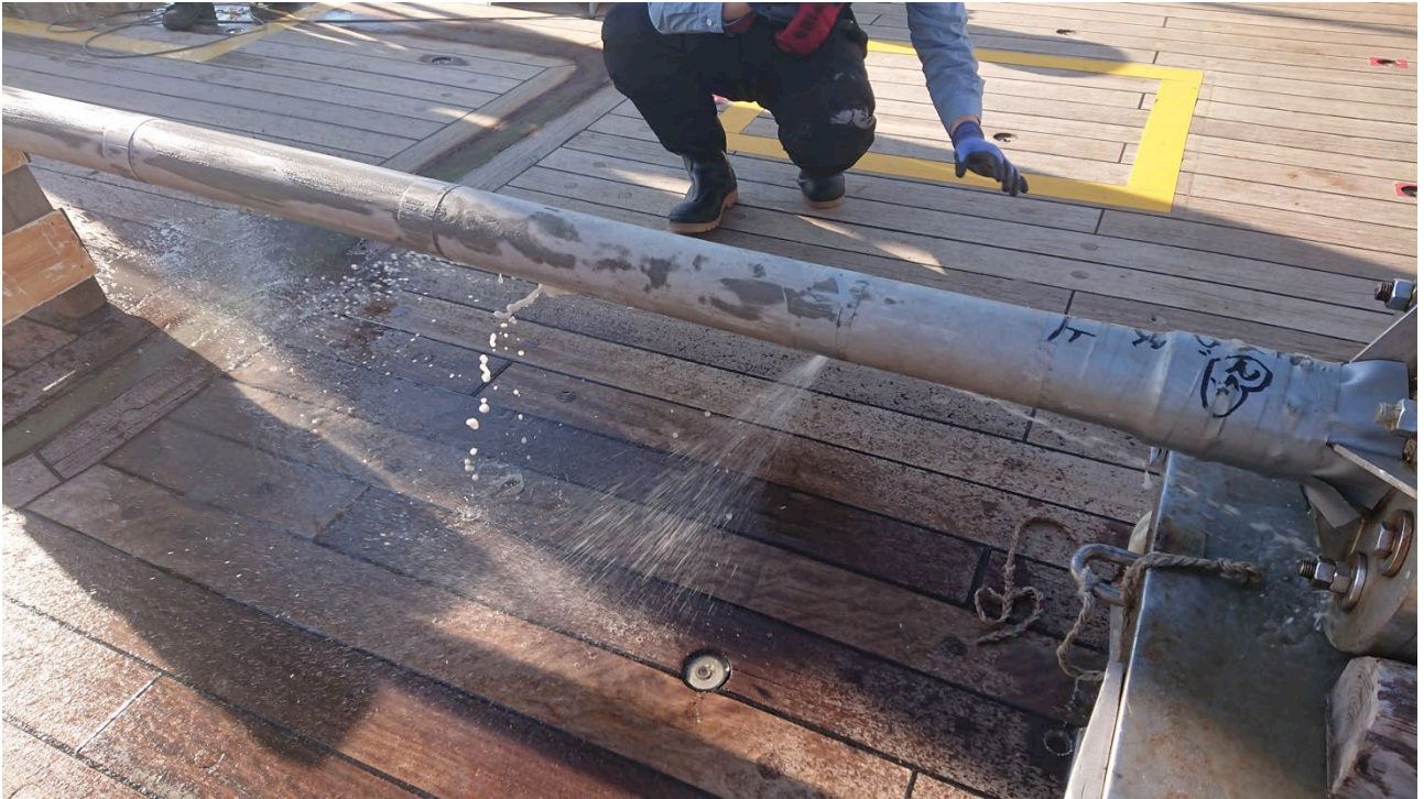
図2 ピストンコアラーから噴き出した海水