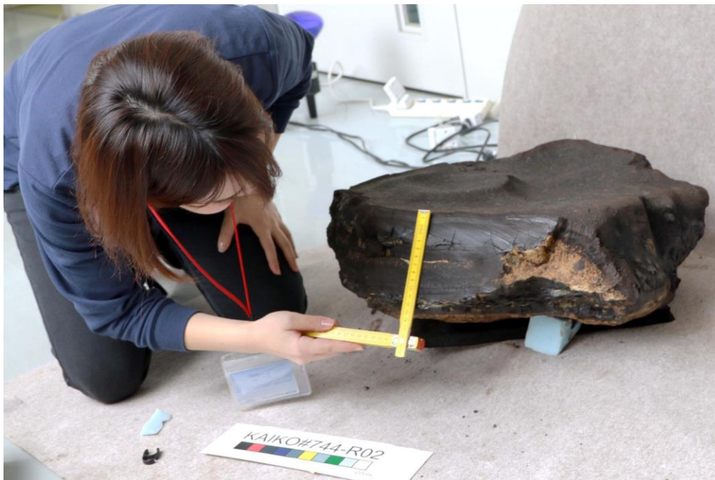
図4：水深3200m付近の厚さ約13cmのコバルトリッチクラストの写真