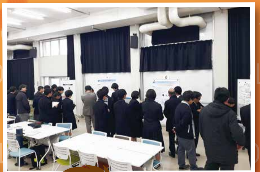
昨年度の会場風景