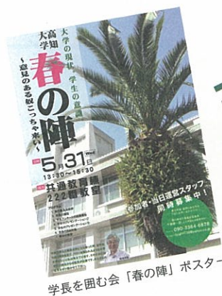
学長を囲む会「春の陣」ポスター

学長からは、「今回限りの開催ではなく、これからも夏の陣や冬の陣としてこういう直接会話のできる場