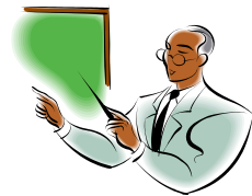
教員がウェブ入力（内容確認）

「教員の自己点検・評価※」のデータ入力は、入力対象者が自ら行います。ただし、評価項目である活動実績（教育活動、研究活動、社会貢献活動、大学運営活動、診療活動の実績）については、業績管理を目的とした教員データベースよりデータの提供を受ける流れとなりますので、まず教員データベースに活動実績を入力いただく必要があります（下図参照）。