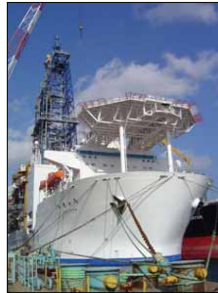
地球深部探査船「ちきゅう」 ( H17年7月完成 )